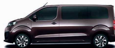
Rich Oak-Braun / hnědá metalíza,