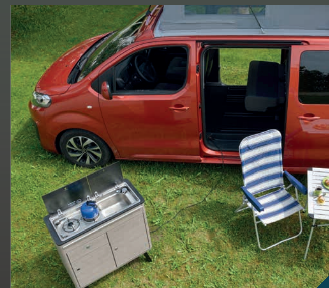
Kuchyňský blok lze snadno vyndat* - až do přírody!

*pouze ve spojení s registrací osobního automobilu