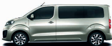
Sand-Beige / pískovoběžová metalíza