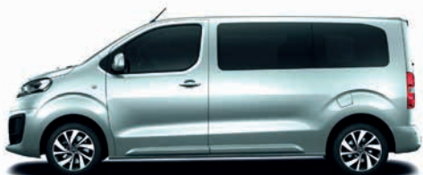
Stahl-Grau / ocelově šedá metalíza