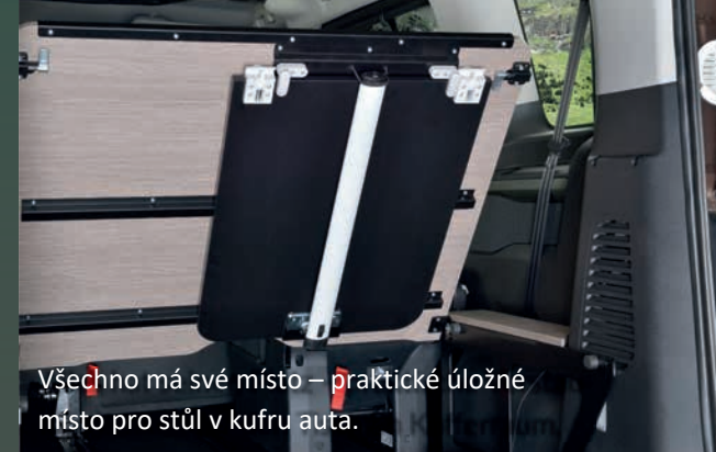
Všechno má své místo – praktické úložné místo pro stůl v kufru auta.

NOVÝ CAMPSTER JE URČEN PRO VŠECHNY A VŠECHNO. PŘEDEVŠÍM DÍKY SVÉMU ROZSÁHLÉMU VYBAVENÍ, KTERÉ JE JIŽ V SÉRIOVÉ VÝBAVĚ, JE PŘIPRAVEN PRO MALÉ JÍZDY, KRÁTKÉ VÝLETY NEBO VELKÉ CESTOVÁNÍ.