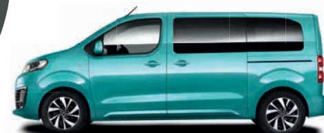
Lagoon Blau / modrá (speciální barva)

Od barvy vozu přes vnitřní vybavu, motorizaci až k různým bezpečnostním paketům.