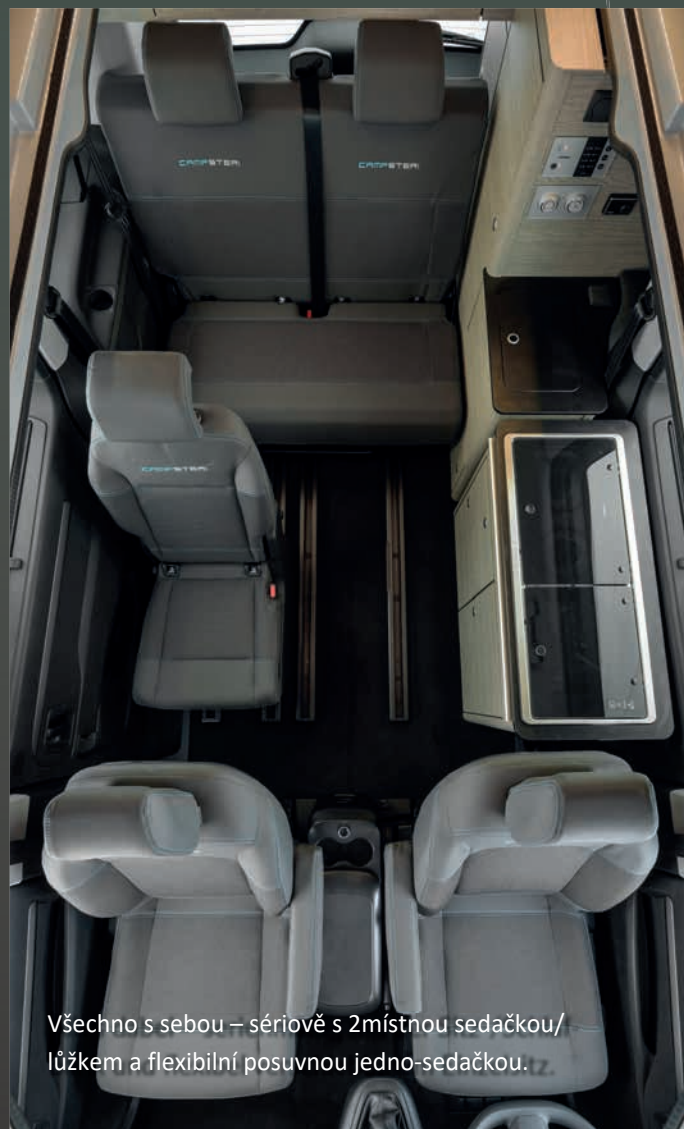
Všechno s sebou – sériově s 2místnou sedačkou/lůžkem a flexibilní posuvnou jedno-sedačkou.