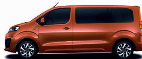
Ardent-Rot / červená (jen Jumpy)