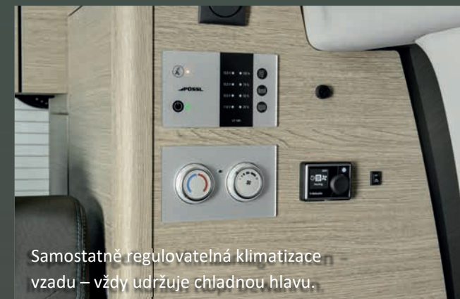
Samostatně regulovatelná klimatizace vzadu – vždy udržuje chladnou hlavu.