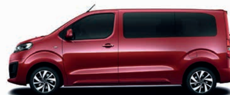
Tourmaline-Orange / oranžová metalíza