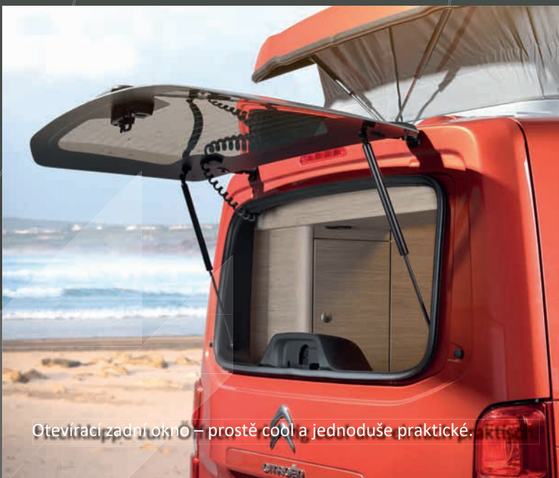
Otevírací zadní okno – prostě cool a jednoduše praktické.