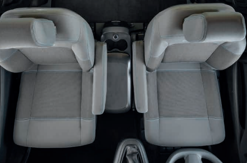
Opce se 7 sedadly

Brzy ráno do kanceláře a hned potom na dlouhý víkend. CAMPSTER je pro to ideální společník. Pohodlný, flexibilní a připravený na cokoli. Nepřizpůsobujete svůj život vozidlu, ale vozidlo ke svému životu.