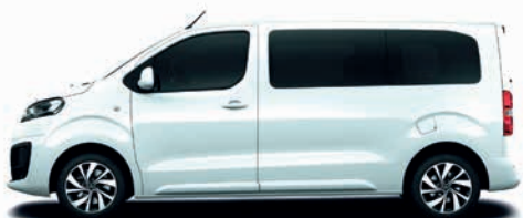
Polar-Weiß / bílá (sériově)