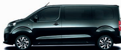
Perla-Nera Schwarz / černá metalíza,