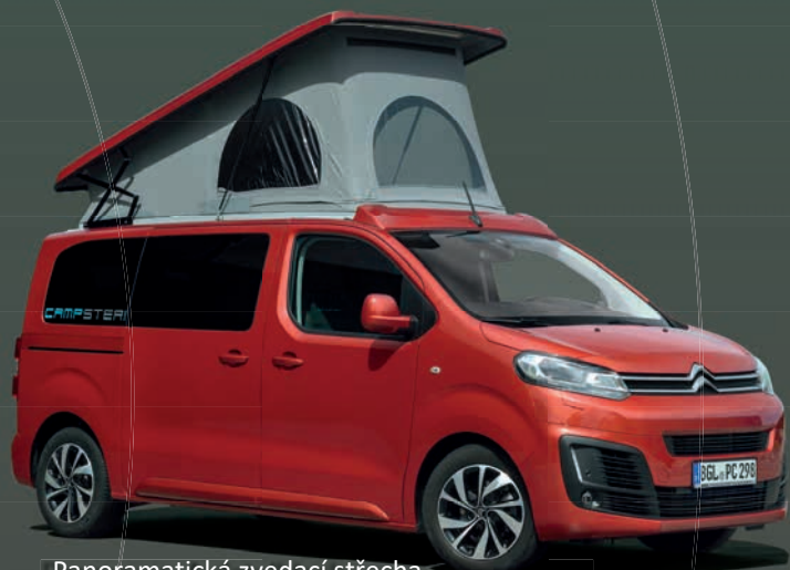
Panoramatická zvedací střecha – nebeskému spánku o kousek blíž.

NOVÝ CAMPSTER JE URČEN PRO VŠECHNY A VŠECHNO. PŘEDEVŠÍM DÍKY SVÉMU ROZSÁHLÉMU VYBAVENÍ, KTERÉ JE JIŽ V SÉRIOVÉ VÝBAVĚ, JE PŘIPRAVEN PRO MALÉ JÍZDY, KRÁTKÉ VÝLETY NEBO VELKÉ CESTOVÁNÍ.