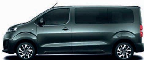
Platinum-Grau / tmavě šedá metalíza